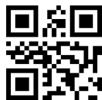
Вывод оригинальных символов