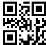
Конвертировать всё в верхний регистр